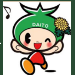
大東市マスコットキャラクター「ダイトン」